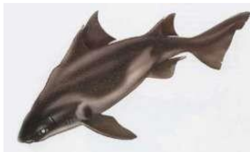
Centrine, cochon de mer/bhim