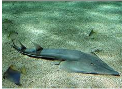
Raie-guitare / mehrath