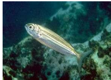
Bou zommara/bouga (bogue)