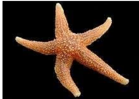
Etoile de mer/nejmetbhar