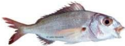
Beaux yeux/ hamraya