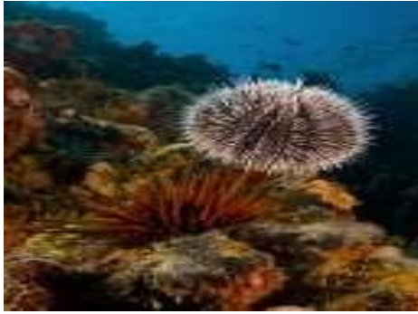
Oursin, hérisson de mer/qanfoubhar