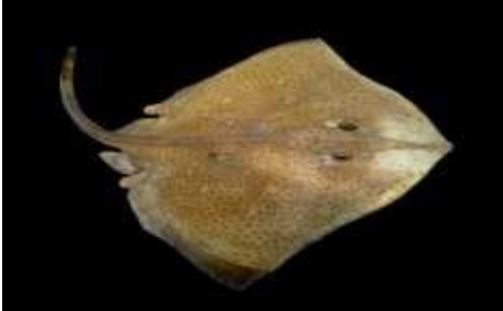
Hsira (raie lisse)