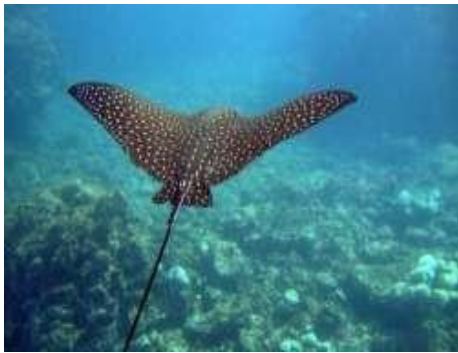
Aigle de mer, raie-aigle/hmèmetbhar