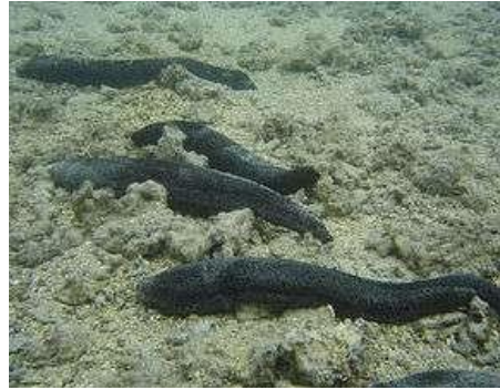
Concombre de mer/khiarbhar