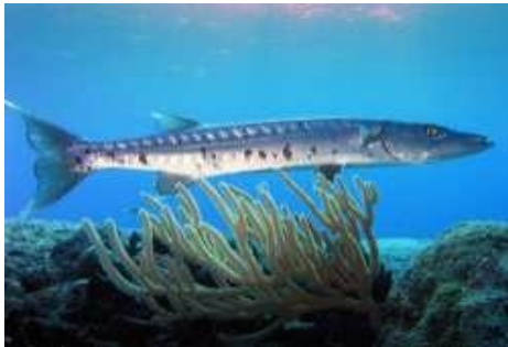
Barracuda, brochet de mer /moghzèl