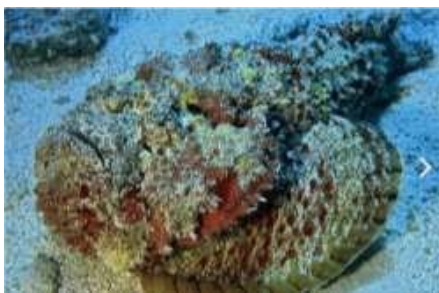
Rascasse brune, crapaud de mer/ boukachèch