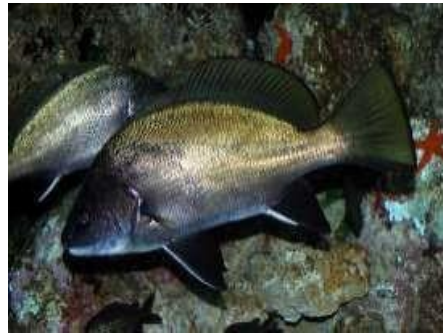
Corb ou corbeau/ghrab