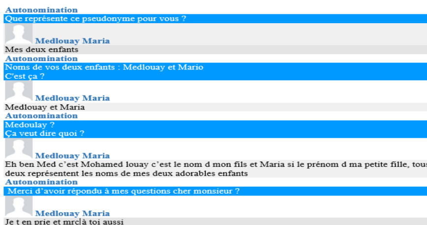
Capture d'écran d'un entretien par messagerie instantané