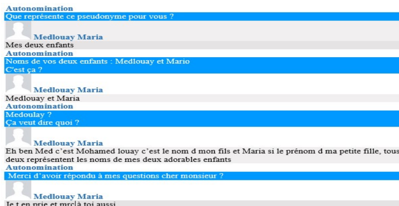
Capture d'écran d'un entretien par messagerie instantané